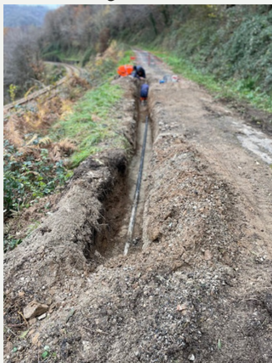
Réseau de Brugale

consommation d'eau potable 0.32 € du m 3 et 0,014 € pour performance des réseaux d'eau sont reversés par la commune à l'agence de l'eau.