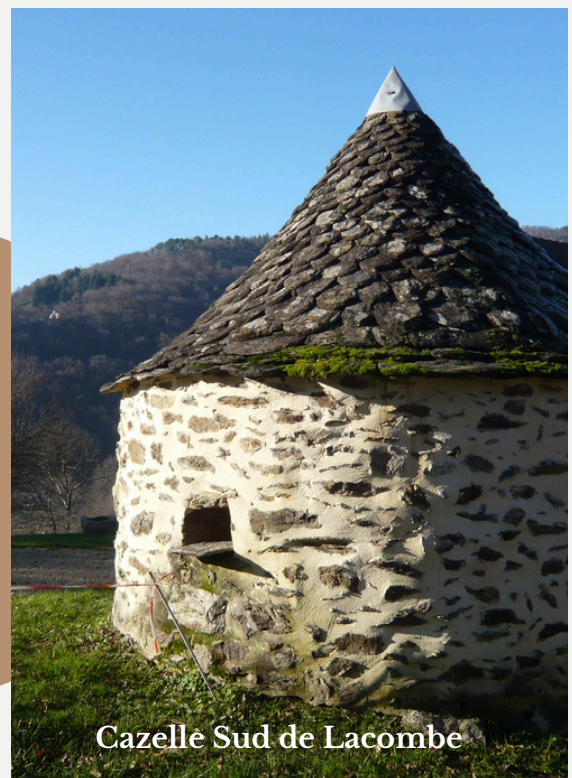
Cazelle Sud de Lacombe

Je vous demande encore une grande vigilance au niveau de l'environnement (ordures ménagères, tri) dans les conteneurs prévus.