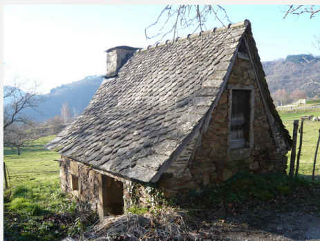
Four à pain au Sol